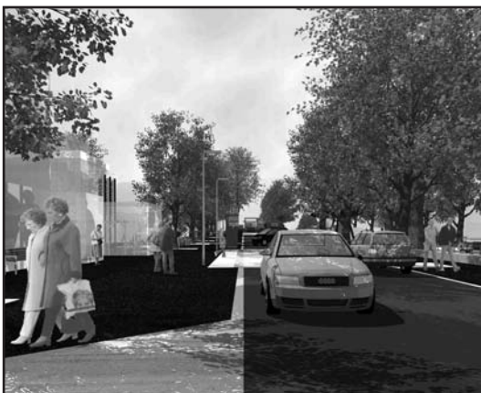
Die künftige Begegnungszone Bremgarten, Blickrichtung Stuckishaus

Veränderungen an dieser im kantonalen Grundbesitz stehenden Verkehrsader prägen das Gesicht der Gemeinde und betreffen viele Einwohnerinnen und Einwohner ganz direkt. Behörden und Planer sind deshalb soweit möglich auf die Eingaben des öffentlichen Mitwirkungsverfahrens von 2003 eingegangen und haben das Gesamtprojekt baulich und kostenmässig angemessen redimensioniert. Das nun zur Ausführung gelangende erste Teilprojekt «Begegnungszone Bremgarten» erstreckt sich von der Strassenkurve beim Unterstufenzentrum bis zum Kalchackerhof. Der zweite Teilbereich Schlosskurve bis zur Begegnungszone kommt nach Auskunft von Adrian Gugger, Projektleiter beim kantonalen Tiefbauamt, frühestens 2010 zur Ausführung. Wann der dritte und streckenmässig längste Teilbereich im Gesamtprojekt Kalchackerstrasse in Angriff genommen wird, steht heute noch nicht fest. Bei diesem letzten Abschnitt werden der Erneuerungsunterhalt der Strasse sowie die Sanierung der Primärwasserleitungen des Wasserverbundes Region Bern im Vordergrund stehen. Die Verlängerung der Buslinie 21 bis zur Verzweigung Kalchackerstrasse / Stuckishausstrasse wurde im Einvernehmen zwischen Kanton, der regionalen Verkehrskonferenz (RVK 4) und den beteiligten Gemeinden Bremgarten und Kirchlindach fallen gelassen.