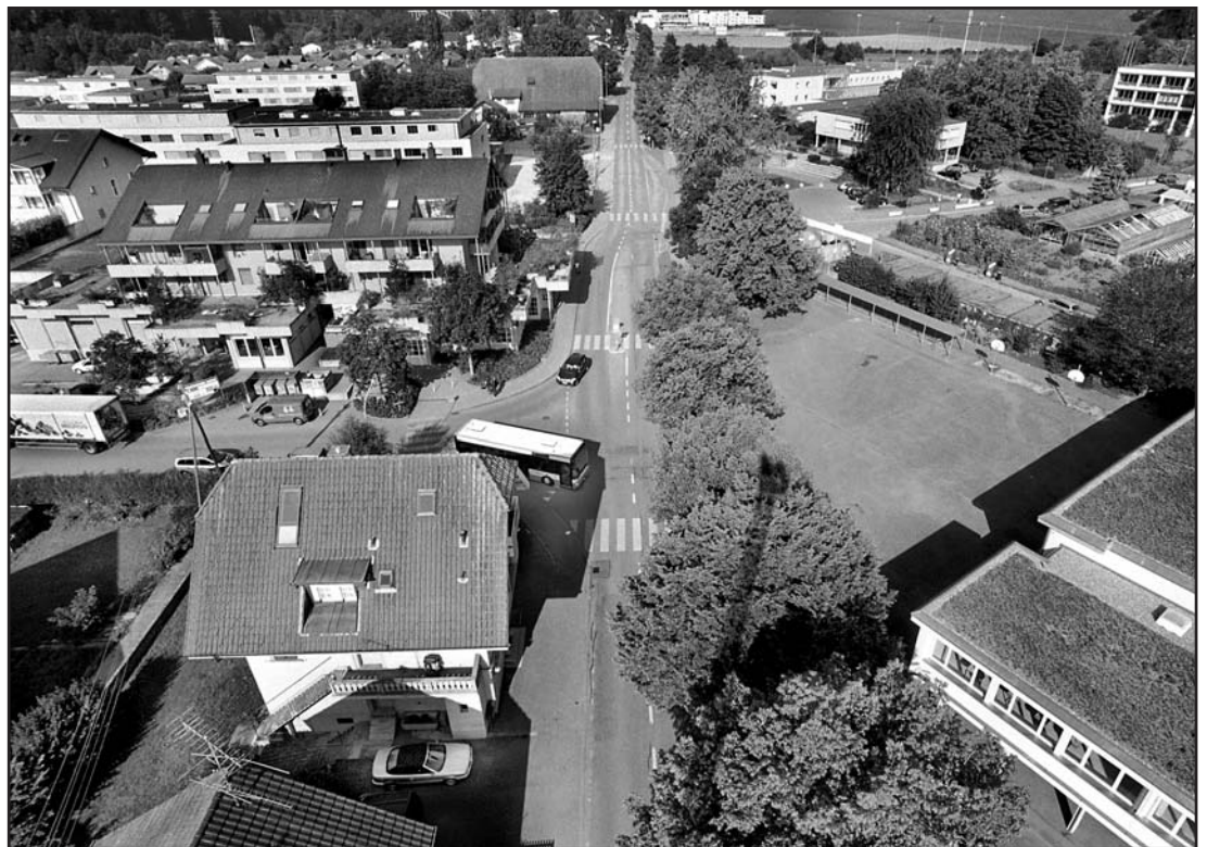
Trotz ungewohnter Perspektive, das Dorfzentrum Bremgarten in gewohnter Gestalt. Das wird sich bald ändern.